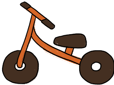
滑步車示意圖(用腳滑行且有兩輪騎乘平衡的玩具)